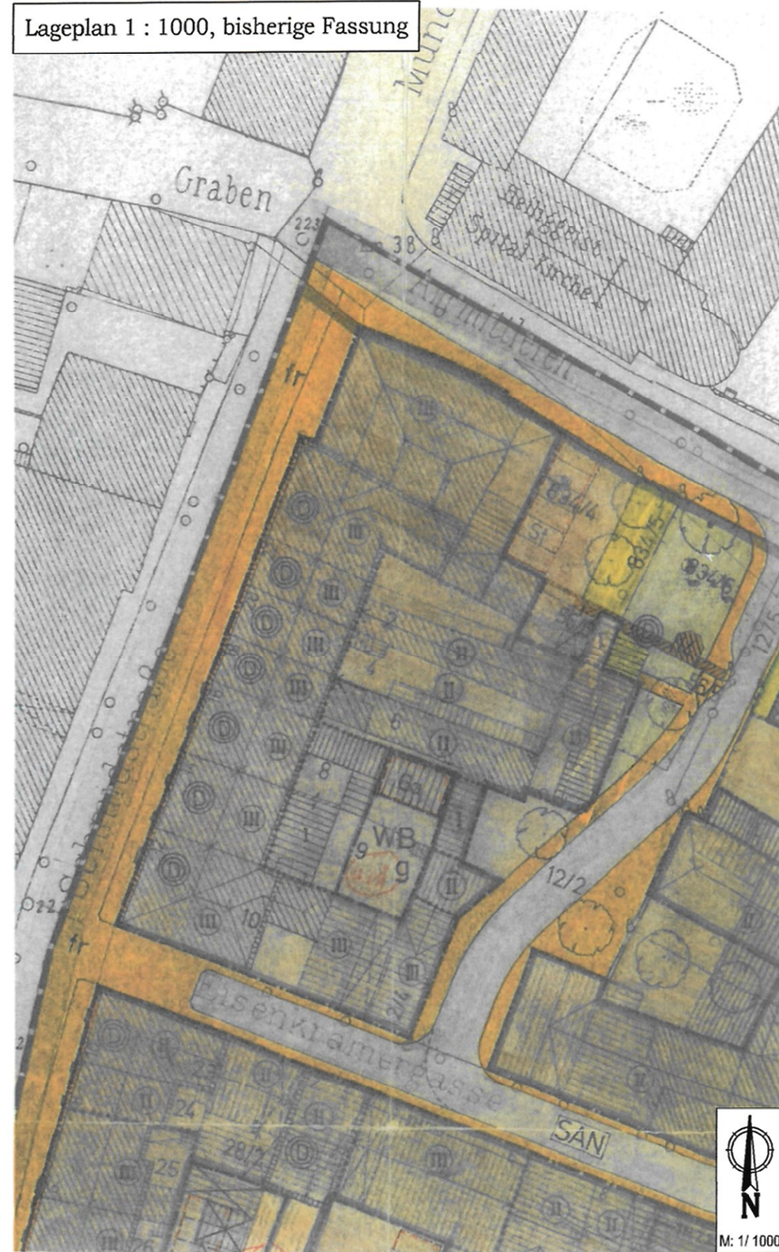
Lageplan 1 : 1000, bisherige Fassung